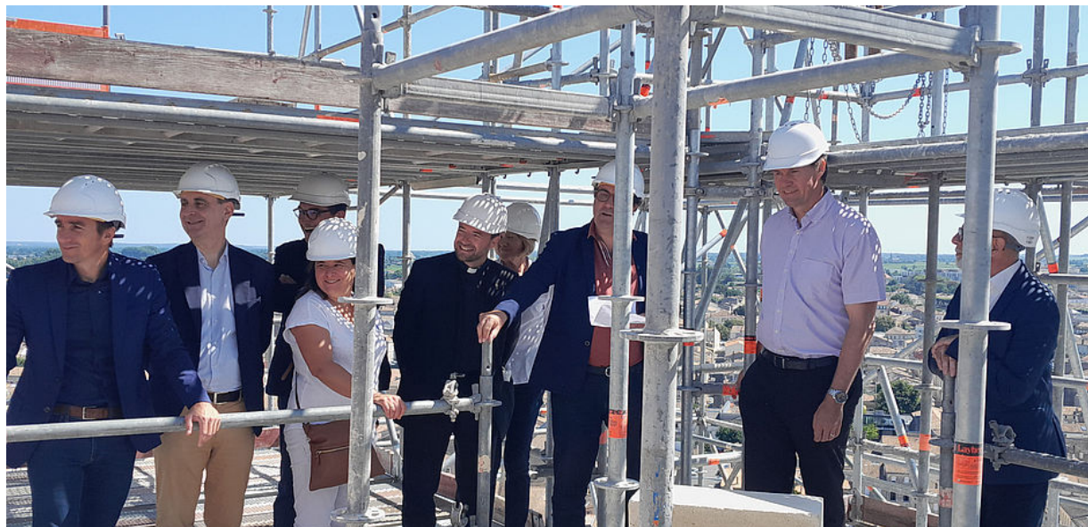
Visite du chantier de remontage de la flèche de l'église Saint-Jean-Baptiste