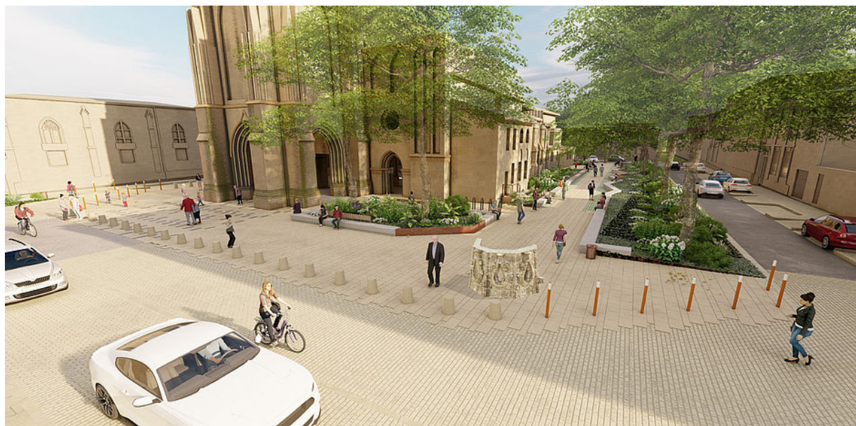
Projection des travaux du parvis de l'église Saint-Jean-Baptiste